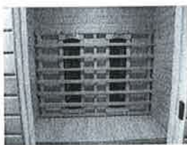
ZADNÍ PANEL SAUNY S KERAMICKÝMI INFRAČERVENÝMI TOPNÝMI JEDNOTKAMI