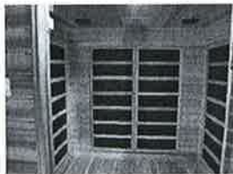
ZADNÍ PANEL SAUNY S TOPNÝMI JEDNOTKAMI Z KARBONOVÝCH VLÁKEN

Obr. 1 Vzhled a rozmístění zářičů v infrasauně (převzato z Návodu na instalaci a použití)