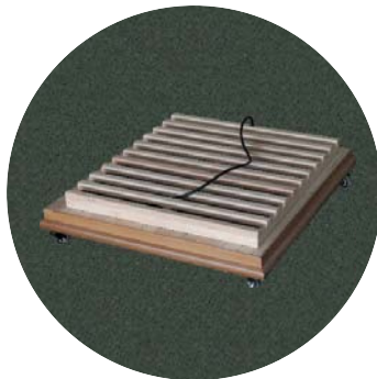
Umístění podlahového topidla