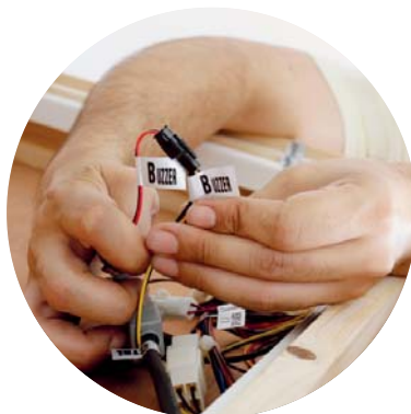
Ukázka propojení kabelů