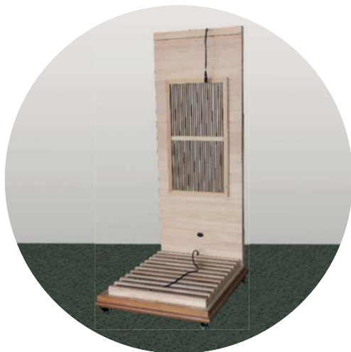
Umístění zadní stěna

Zadní stěnu umístěte na podlahu. Pozor, nebude stát sama, do umístění další stěny bude nutné ji přidržet.