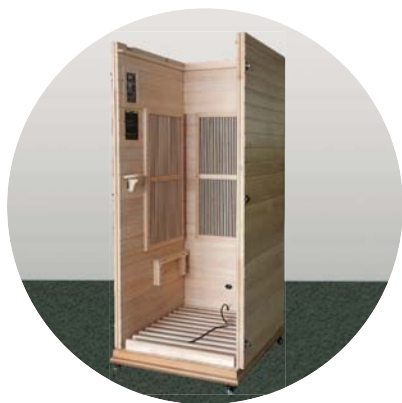
Umístěná levá stěna