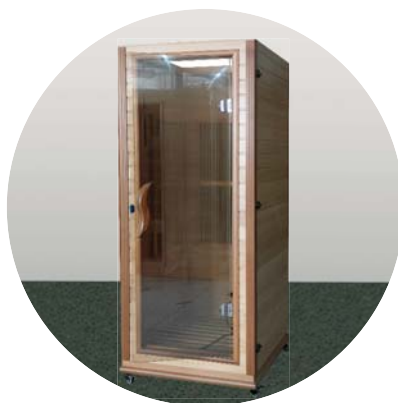
Umístěná přední stěna

Přední stěnu přiložte k pravé a levé stěně na podlahu a připevněte ji zacvakávacími sponami. Nainstalujte na dveře dřevěné madlo.