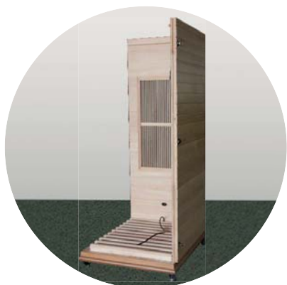
Umístěná pravá stěna

Pravou stěnu usaďte na podlahu a umístěte ji k zadní stěně. Upevněte ji zacvakávacími sponami.