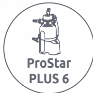
ProStar PLUS 6