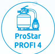
ProStar PROFI 4