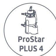
ProStar PLUS 4