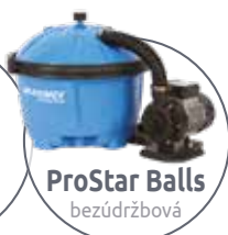
ProStar Balls bezúdržbová