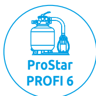
ProStar PROFI 6