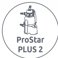
ProStar PLUS 2